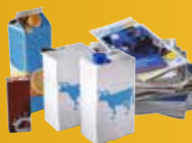
Briques (avec bouchons) papier, journaux, revues.