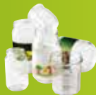
Pots & bocaux en verre

DANS VOTRE BAC D'ORDURES MÉNAGÈRES À LA MAISON