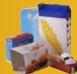
Boîtes et carton, boîte à œufs, cartonnette.