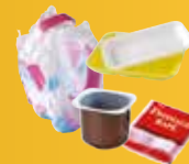
Pots de yaourt, barquettes séparées du film plastique, sacs et suremballage.

Tous les emballages en vrac dans votre bac de tri SANS LES IMBRIQUER !