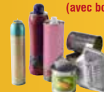
Bidons, aérosols, boîtes de conserves, barquette alu.