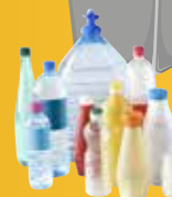
Bouteilles, bidons, flacons en plastique (avec bouchons).