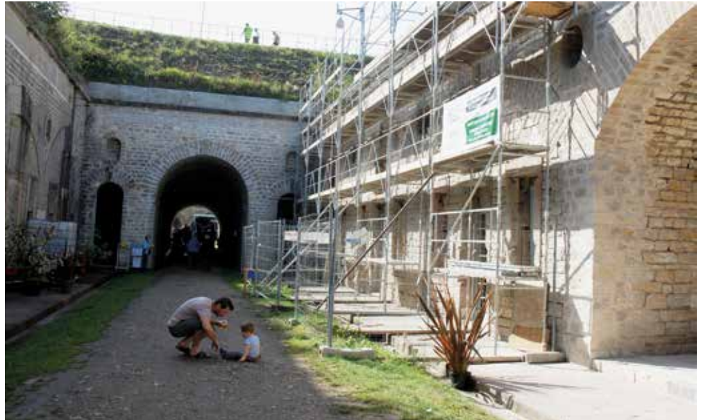
Fort du Mont-Vaudois Cour d'Honneur

La Communauté de Communes du Pays d'Héricourt comme pour les précédentes opérations maintient son soutien. La CCPH participera à parité, avec la Ville au reliquat de cette opération, après versement