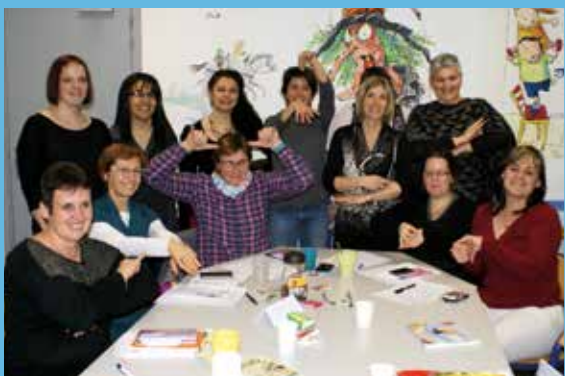
Assistantes Maternelles RPAM Héricourt

• 4000 € seront alloués à l'entretien du sentier Erige et 3 600 € au sentier de Byans.