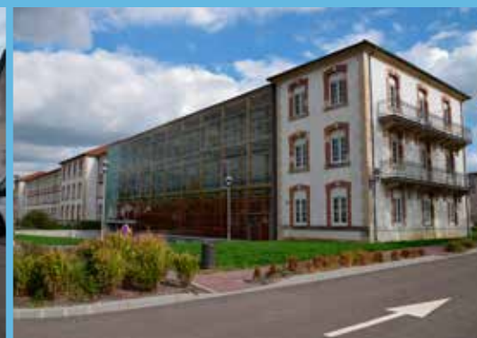
Ecole de Musique