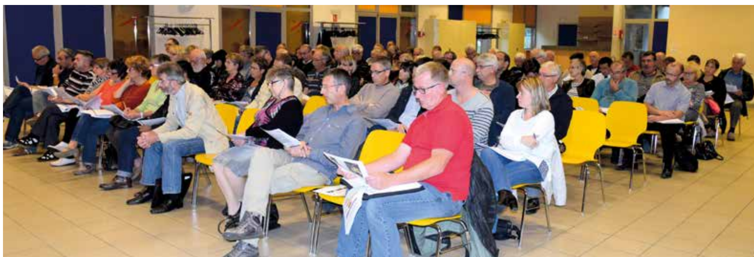
Réunion à Coisevaux le 22 septembre 2015

Le 10 décembre 2015, le Conseil Communautaire réuni au Centre d'Affaires Pierre Carmien a approuvé cette prise de compétence. L'élaboration du PLUi sera lancée au printemps 2016 sur l'ensemble du territoire y compris Luze. Elle durera trois années et s'achèvera au mois de janvier 2019.