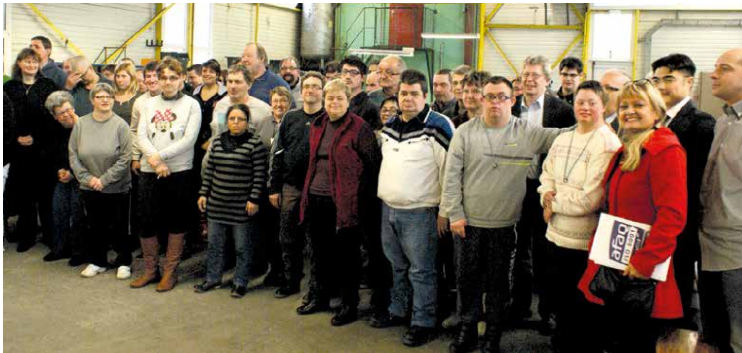
Les salariés de l'ESAT le 8 janvier 2016