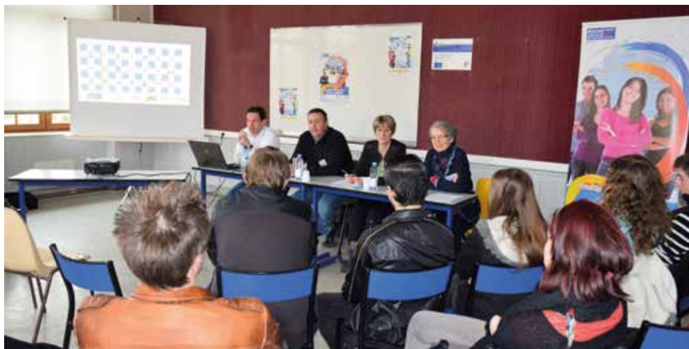
Mission Locale - Formation