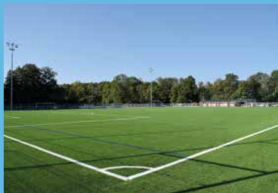
Stade synthétique de Brévilliers