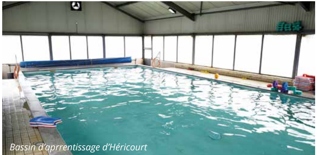
Bassin d'apprentissage d'Héricourt

Par ailleurs la localisation à Héricourt, permettra d'éviter toutes formes de contestations de la part du Conseil Départemental de la Haute-Saône en