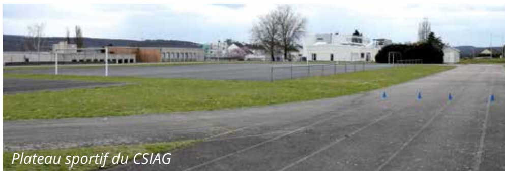
Plateau sportif du CSIAG

La piste sera décaissée et des bordures de délimitation seront posées. La piste sera réalisée en enrobé avec de nouveaux tracés. Le cabinet Delplanque a été retenu en tant que maître d'œuvre de cette opération.