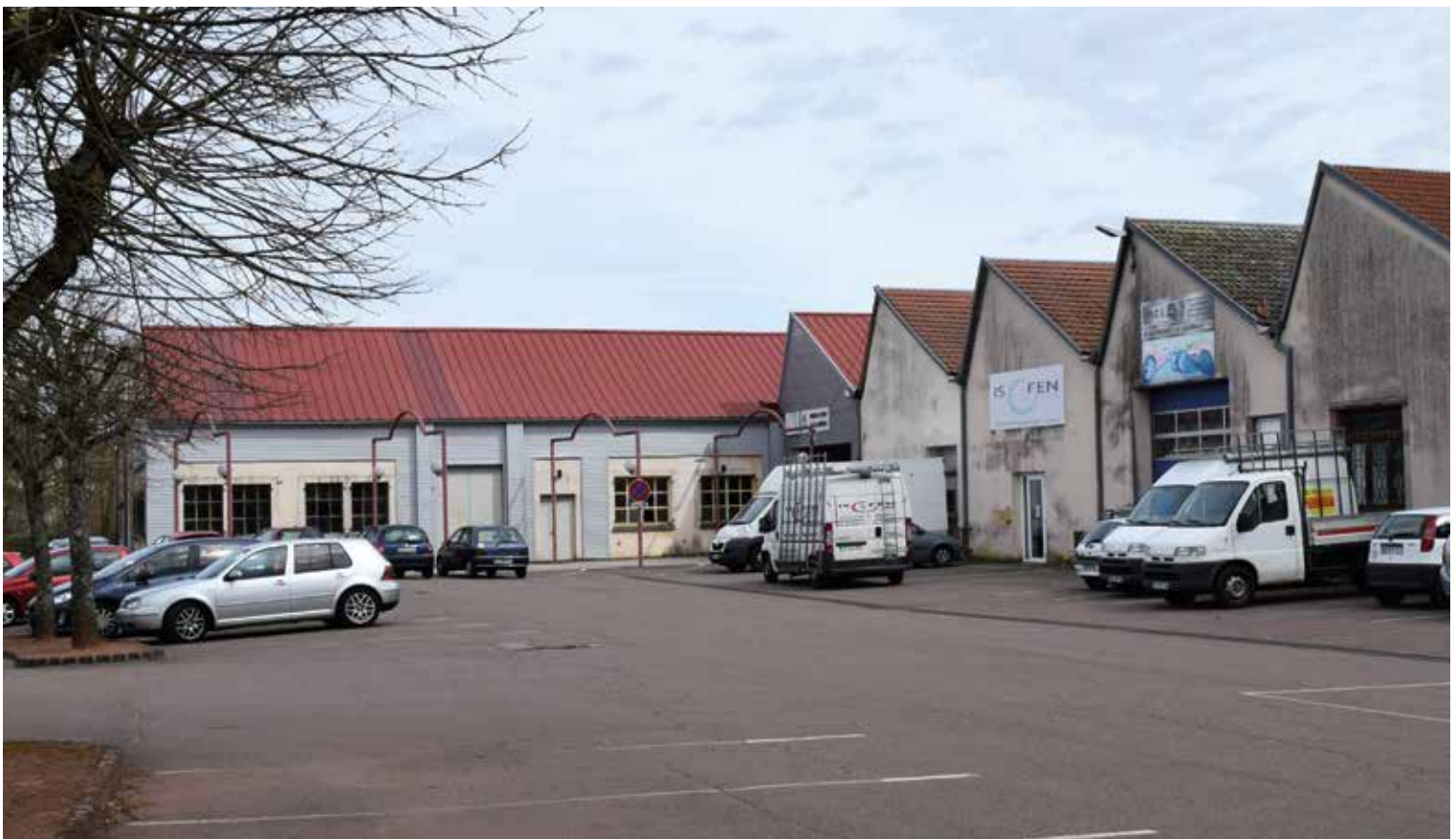
Filature du Moulin

taire qui vise à redynamiser le cœur de la Ville Centre, a été exposé dans sa globalité avec la présentation des aménagements qui seront réalisés ainsi que sa future destination économique. Le projet communautaire