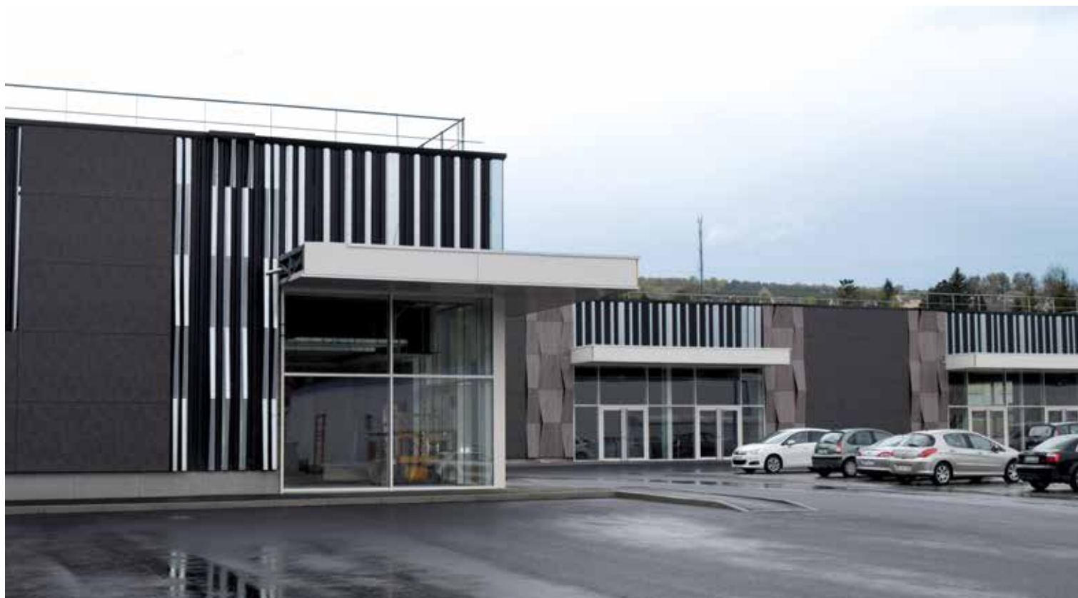
La nouvelle galerie commerciale du centre commercial Leclerc