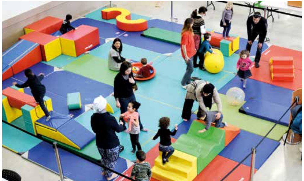
La Cavalerie : jeux d'obstacles pour les petits

Répartis sur plusieurs espaces distincts et placés librement à l'usage des visiteurs, des jeux les plus divers étaient mis à la disposition des joueurs. Petits et grands se sont follement amusés et ont profité avec plaisir du grand nombre de jeux qui était mis à leur disposition, jeux vidéos, jeux de construction, jeux de société... Des animateurs spécialisés ont apporté leur concours, en donnant des conseils avisés aux joueurs et leur aide précieuse quant à l'organisation matérielle de cette manifestation. Cette journée dédiée au jeu et à la rencontre entre toutes les générations a rempli ses objectifs. Jeunes et moins jeunes ont joué ensemble et ont eu l'occasion de s'éprouver en s'essayant aux jeux les plus divers.