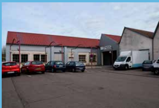
Filature du Moulin