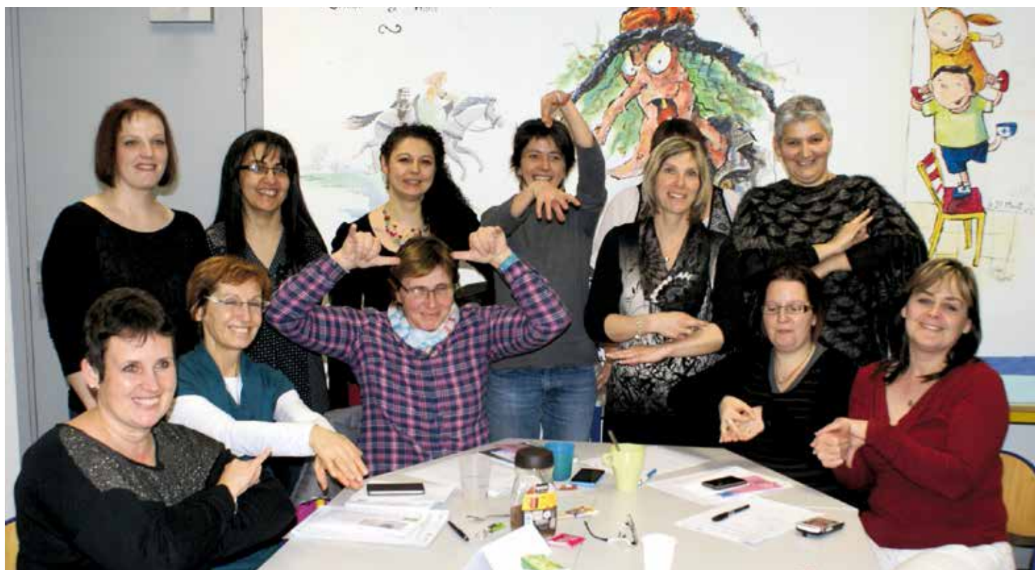
Formation des assistantes maternelles le 20 février 2016

bras et de leurs mains que ceux de leur bouche. Ils sont capables de communiquer par gestes bien avant de pouvoir le faire oralement. L'utilisation de la langue des signes permet aux enfants "préverbaux" de disposer rapidement d'un large vocabulaire pour s'exprimer et être mieux compris de leur entourage en attendant que la parole se mette en place. Ainsi, des mois, voire des années avant d'être en mesure de parler, les enfants peuvent signifier aux autres leurs émotions et sensations. Ils peuvent demander ce dont ils ont besoin. Ils peuvent préciser ce qui leur