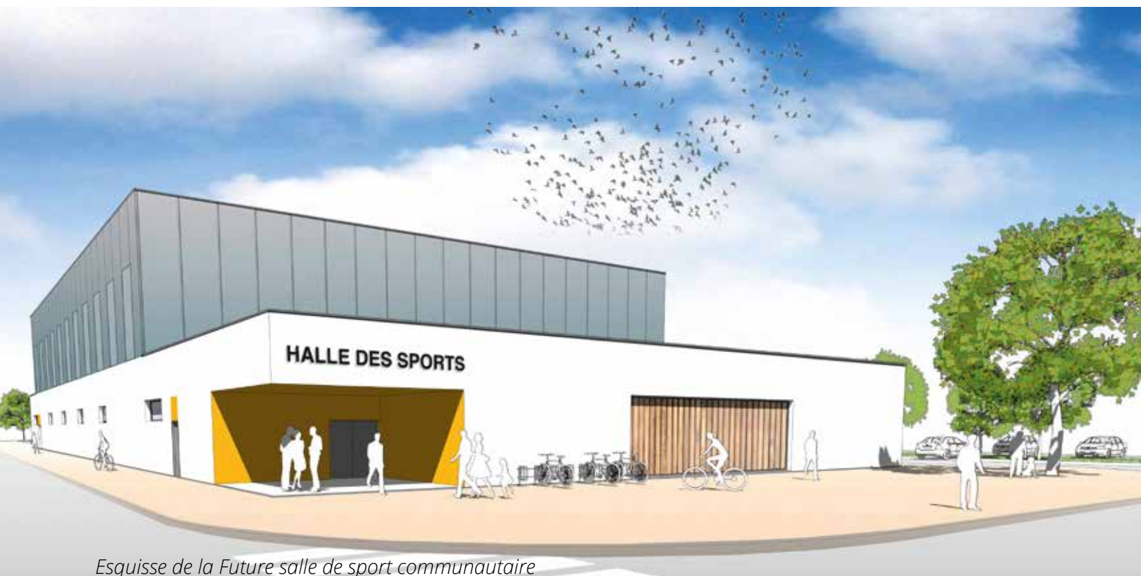
Esquisse de la Future salle de sport communautaire

L'implantation de cette future troisième salle sera située aux côtés du parking qui sera prochainement réalisé