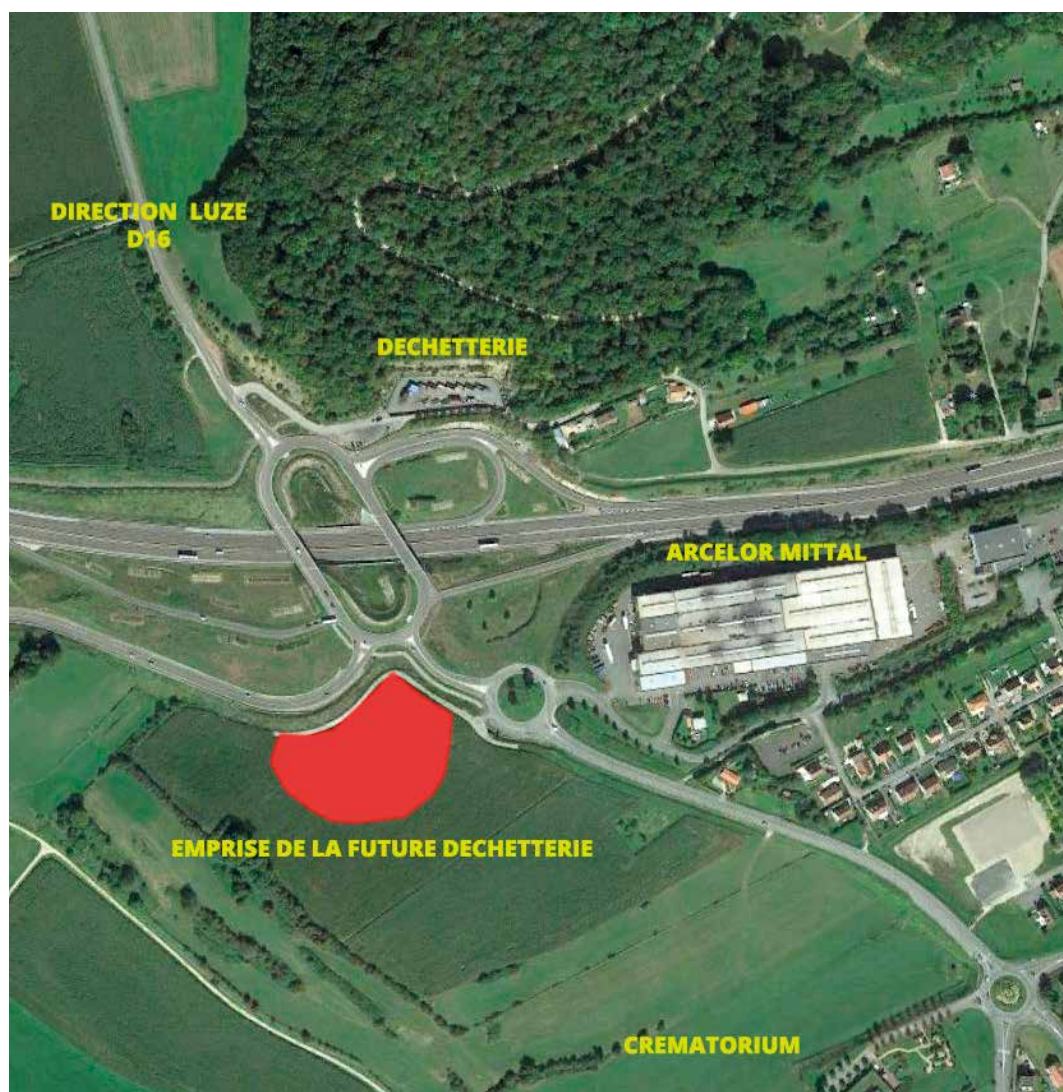
Emprise de la nouvelle déchetterie

L'actuelle déchetterie située rue du Fort du Mont-Vaudois ne peut plus répondre aux besoins et aux attentes des usagers. Enclavée, elle ne peut être modernisée ou adaptée aux nouveaux besoins liés à la très forte augmentation de sa fréquentation.