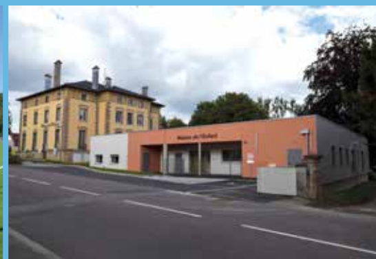
Maison de l'Enfant