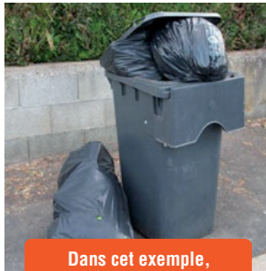
Dans cet exemple, 2 levées seront comptées.

Il est interdit de déposer des sacs à côté des bacs de collecte. Tout déchet sauvage fera l'objet d'un dépôt de plainte et est punissable d'une contravention ou d'un délit.