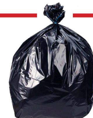
Ne pas mettre de sacs-poubelle vides ou pleins, le bac vert est là pour ça !