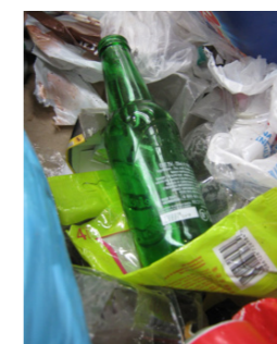
Ne pas mettre de bouteilles en verre, utiliser les POINTS VERRE.