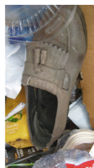
Ne pas mettre de textile ou de chaussures, utiliser les points de collectes prévus à cet effet.