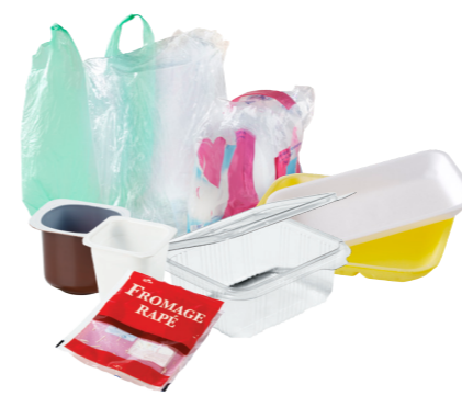
Et les p'tis nouveaux... (pots, barquettes, sachets...)