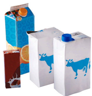
Briques en carton