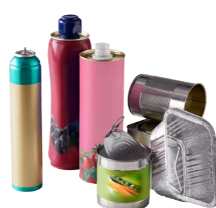
Emballages en métal