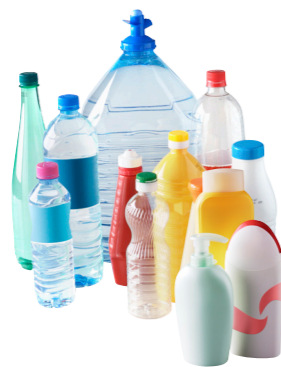
Bouteilles et flacons en plastique