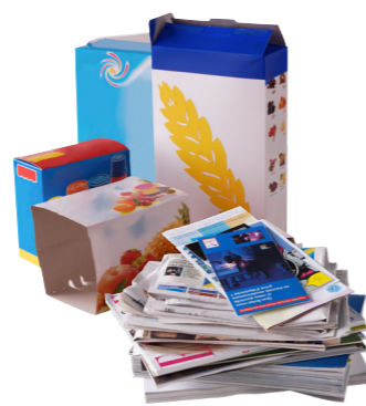
Papiers et emballages en carton