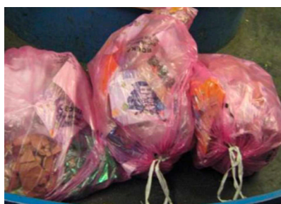
Ne pas mettre de tri en sacs, mais en vrac !