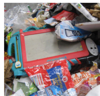
Ne pas mettre de jouets en plastique mais les déposer en déchetterie.