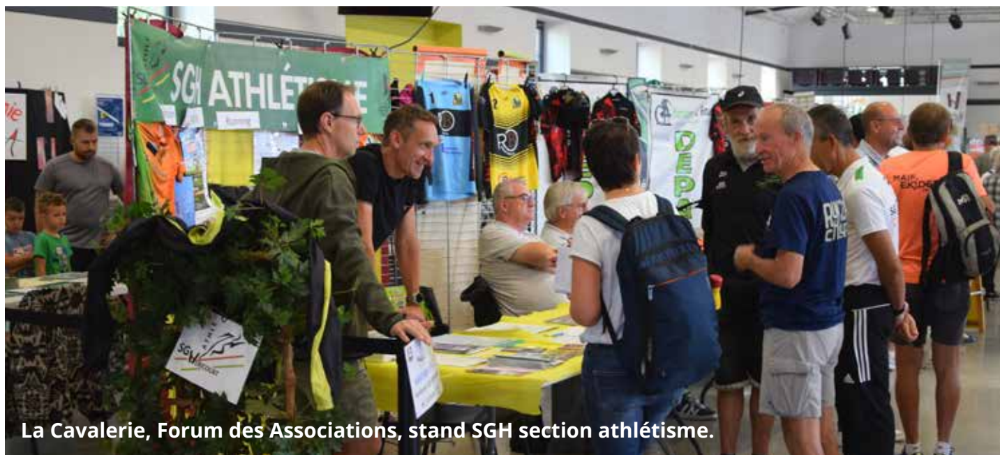
La Cavalerie, Forum des Associations, stand SGH section athlétisme.

Le Forum des Associations, a rencontré une nouvelle fois un franc succès. 52 associations ont répondu présentes à la Cavalerie, attirant plus de 1 500 visiteurs venus à la rencontre du tissu associatif local.