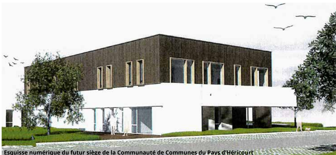
Esquisse numérique du futur siège de la Communauté de Communes du Pays d'Héricourt

Le conseil communautaire a validé le jeudi 03 juillet 2025 l'avant-projet sommaire du futur siège de la Communauté de communes du Pays d'Héricourt. Ce bâtiment neuf marquera une nouvelle étape dans le développement des services communautaires