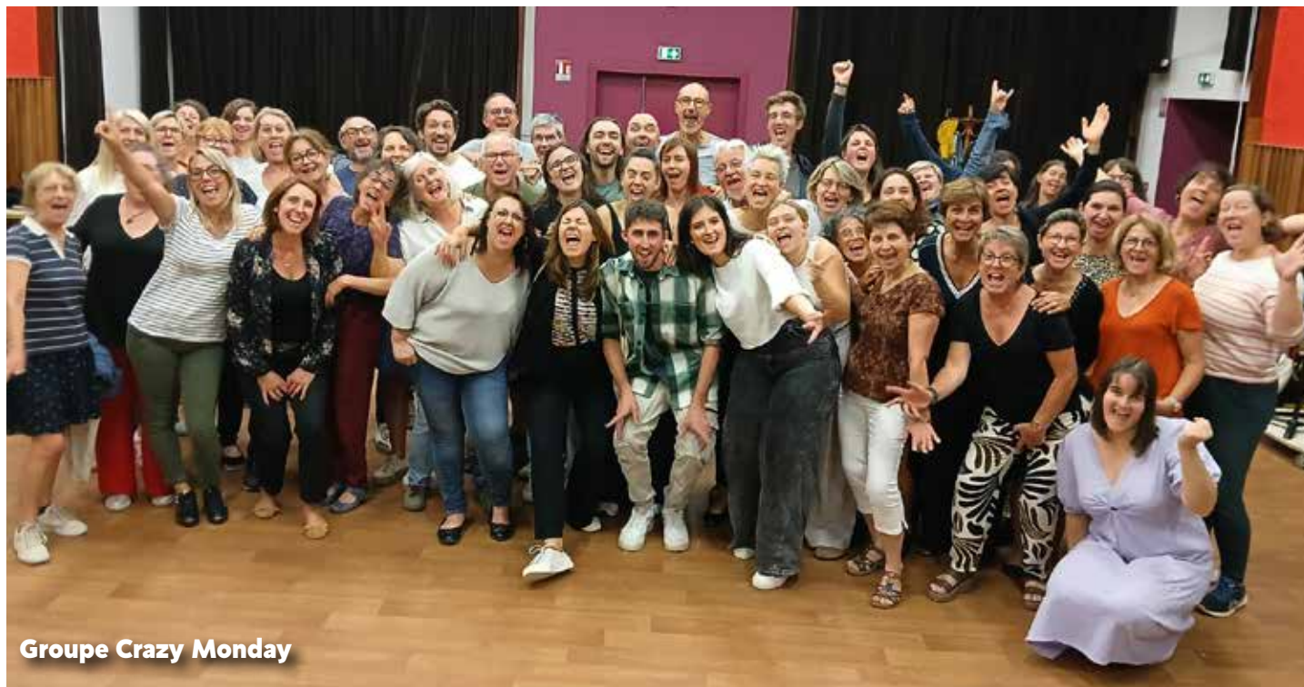
Groupe Crazy Monday

L'atelier de comédie musicale de l'Ecole de Musique du Pays d'Héricourt prépare une nouvelle saison haute en couleurs. Le Chœur Choreia nous embarque dans l'ambiance des années 1960. Des tubes et des danses légendaires.