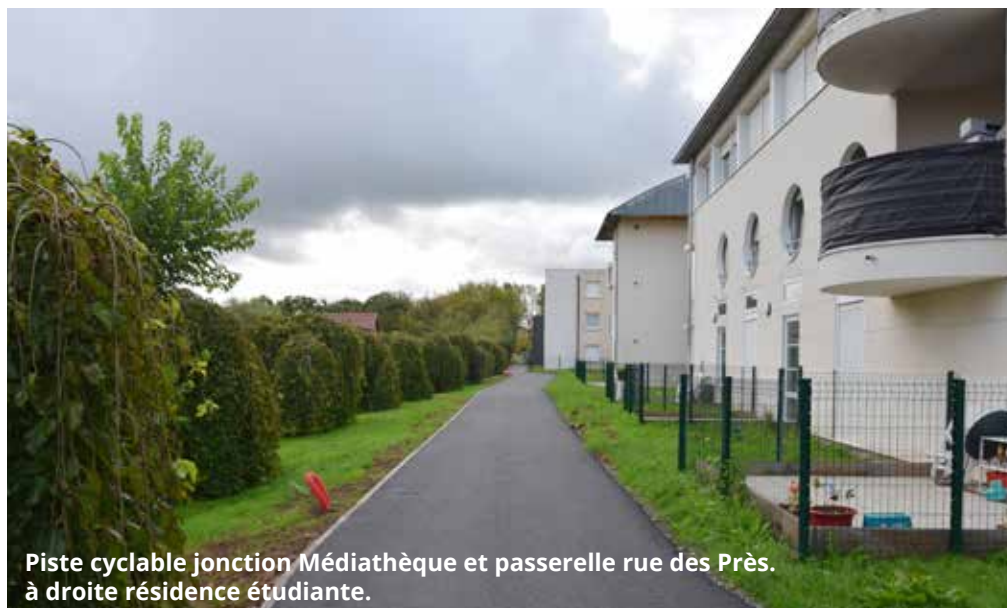
Piste cyclable jonction Médiathèque et passerelle rue des Prés. à droite résidence étudiante.

La commune d'Héricourt développe son réseau de pistes cyclables, cet été de nouveaux aménagements ont été réalisés. Cinq nouveaux tronçons ont été créés.