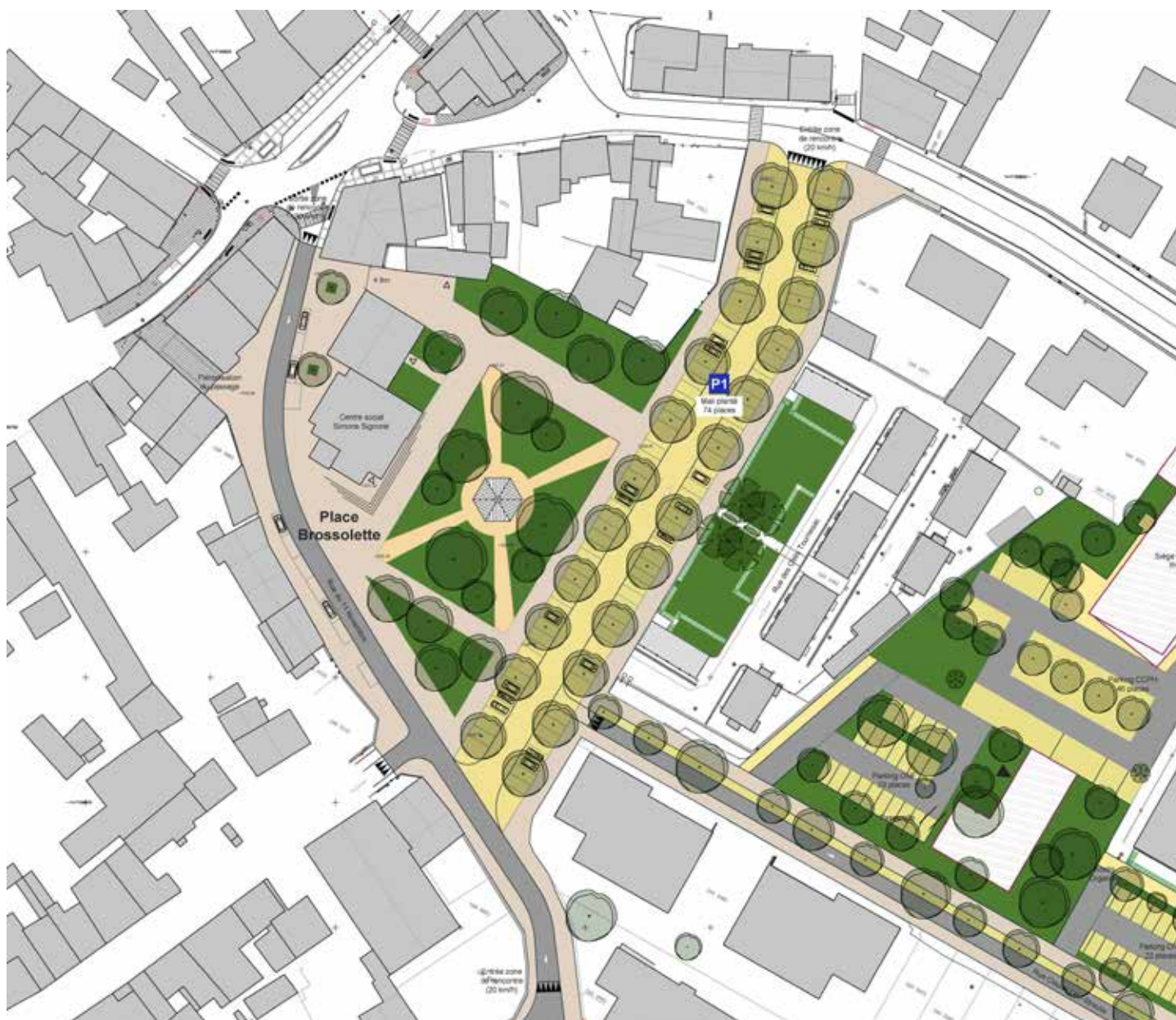
Requalification de la Place du Marché, esquisse numérique n°1.

La transformation du centre ville se poursuit. Après la construction de la gare routière et la renaturation de la friche Packmat, c'est au tour de la Place du Marché d'être requalifiée.