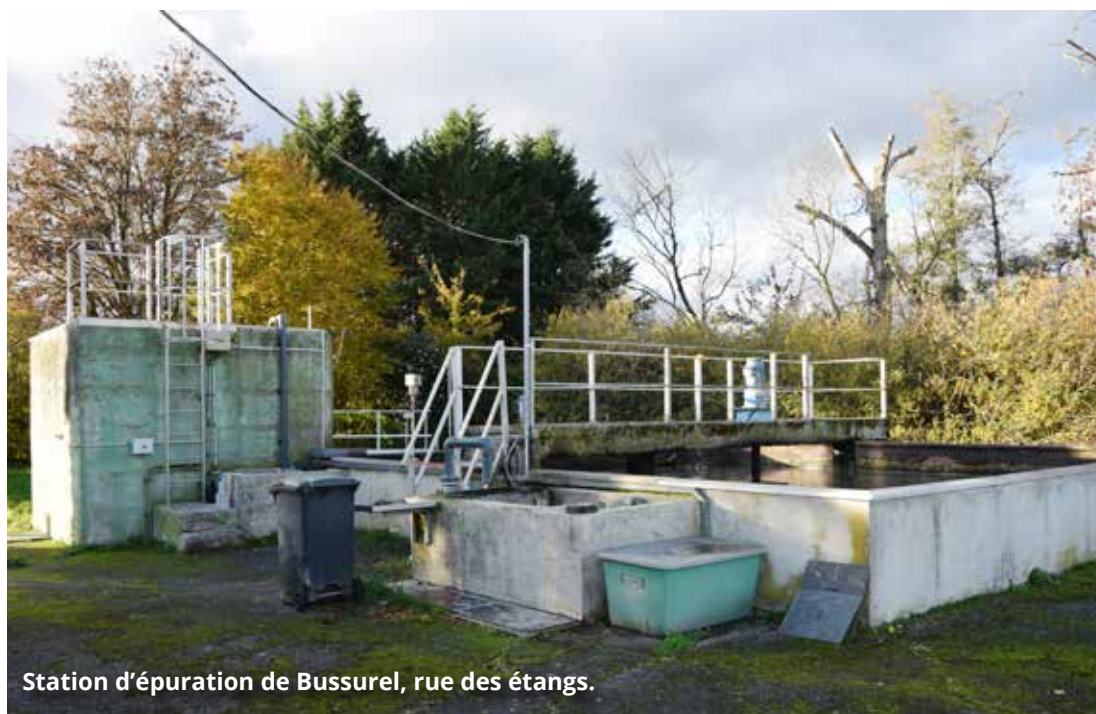
Station d'épuration de Bussurel, rue des étangs.

Du 30 septembre au 2 octobre 2025, la station d'épuration de Bussurel a fait l'objet d'une opération d'entretien d'envergure. L'occasion de faire le point sur son état de fonctionnement et de s'assurer de sa pérennité.