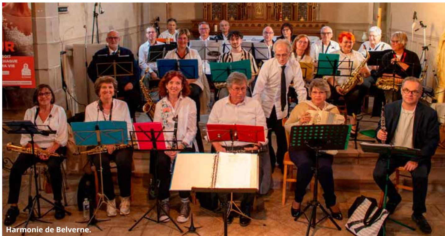
Harmonie de Belverne.

Nichée au cœur des bois du Chérumont, dans le petit village de Belverne (135 habitants), l'Harmonie de Belverne s'apprête à fêter ses 50 ans.