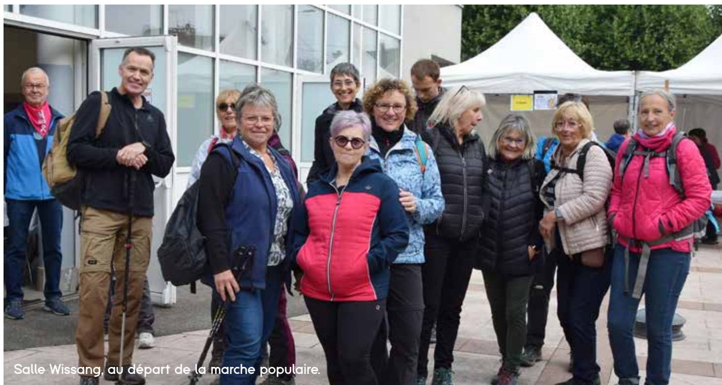
Salle Wissang, au départ de la marche populaire.

La Marche Buissonnière d'Héricourt et le Centre Communal d'Action Sociale ont proposé et organisé dans le cadre de la manifestation Octobre Rose plusieurs animations : trois circuits de randonnée et des ateliers de prévention santé.