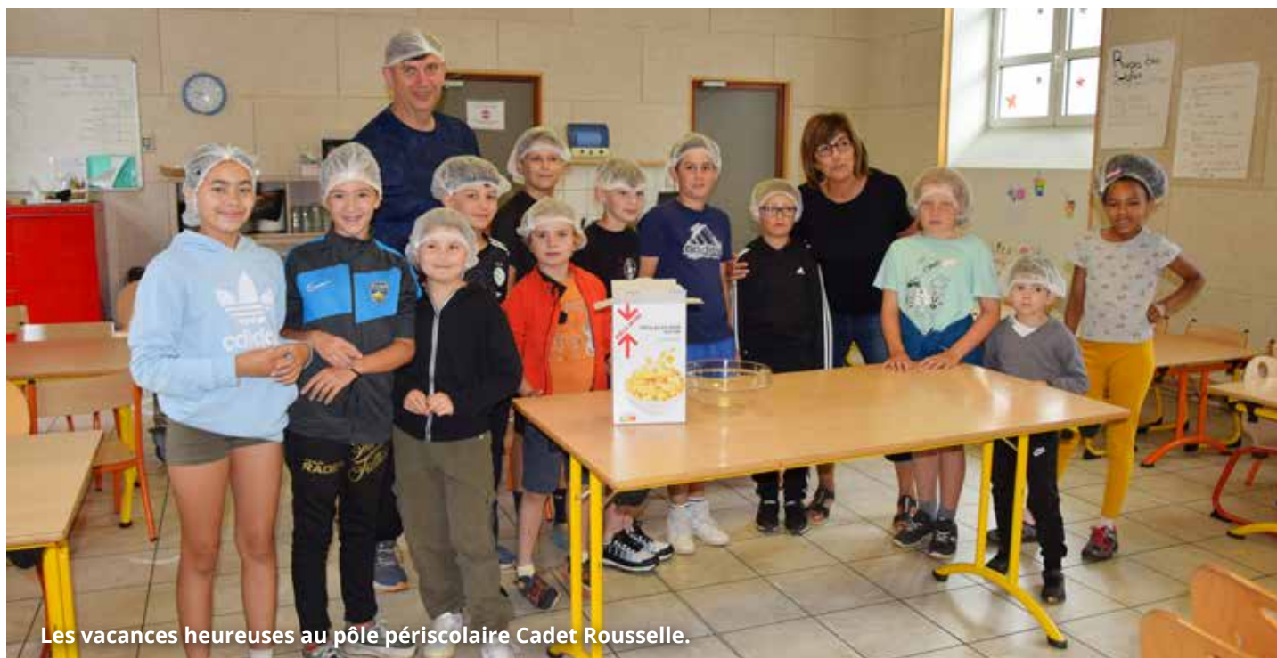
Les vacances heureuses au pôle périscolaire Cadet Rousselle.

Cet été, près de 300 enfants du territoire d'Héricourt ont profité de trois semaines d'activités ludiques et éducatives dans les centres périscolaires de la Communauté de communes. Entre sorties nature, aventures sportives et moments conviviaux, les vacances ont rimé avec plaisir et curiosité.