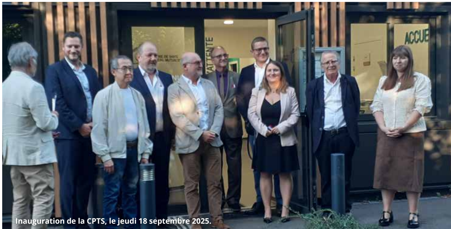
Inauguration de la CPTS, le jeudi 18 septembre 2025.

Jeudi 18 septembre 2025, la Communauté Professionnelle Territoriale de Santé (CPTS) du Pays d'Héricourt a inauguré son cabinet médical « Du fil au soin » dans ses locaux définitifs au 8, rue Edgar Faure à Héricourt.