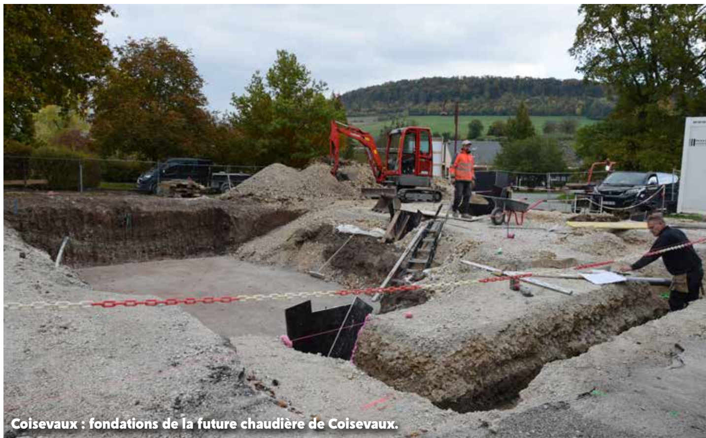
Coisevaux : fondations de la future chaudière de Coisevaux.

La construction de la chaufferie bois décidée, par la Commune de Coisevaux, la CCPH et le Syndicat Intercommunal à Vocation Unique (SIVU) des cinq communes du Pays d'Héricourt du pôle des écoles liées (Coisevaux, Héricourt, Tavey, Trémoins et Verlans) a commencé.