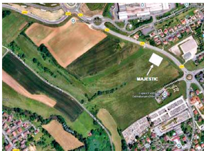
Vue aérienne implantation du cinéma Majestic du Pays d'Héricourt.

Avec plus de 155 000 entrées annuelles estimées, le cinéma attirera un public provenant de toute l'Aire Urbaine. Il s'inscrit pleinement dans la démarche « Petites Villes de Demain », dont Héricourt est bénéficiaire, et participera à la revitalisation du centre-ville comme à l'amélioration du cadre de vie des habitants.