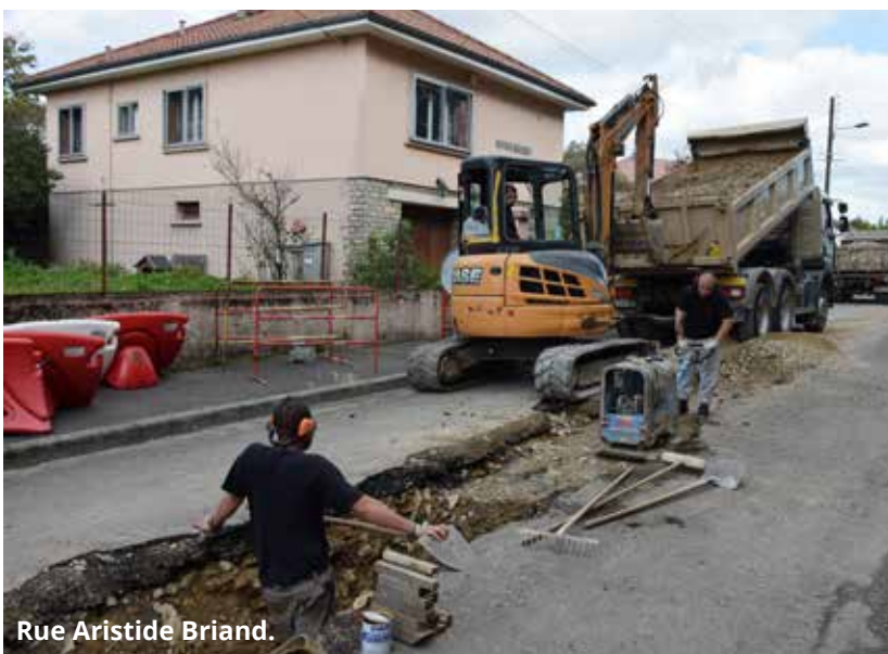
Rue Aristide Briand.

La commune d'Héricourt poursuit son programme de rénovation de son réseau d'alimentation en eau potable. Des travaux pour remplacer des conduites en fonte grise par des conduites en fonte ductile, matériau plus solide.