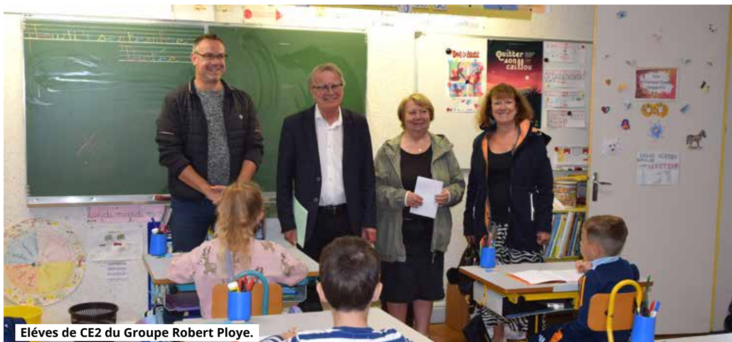
Elèves de CE2 du Groupe Robert Ploye.