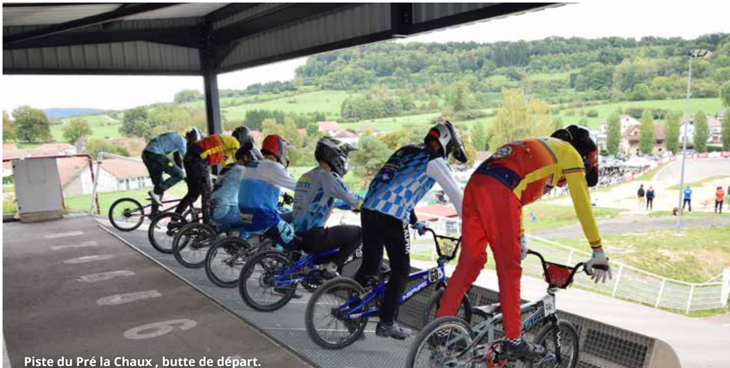
Piste du Pré la Chaux , butte de départ.

Le club de BMX de Champey Pays d'Héricourt a organisé, dimanche 21 septembre, sur la piste du Pré-la-Chaux, la deuxième manche de la Coupe de Bourgogne-Franche-Comté. 264 pilotes, venus de tout le Grand Est ont été encouragés par 1 200 spectateurs.