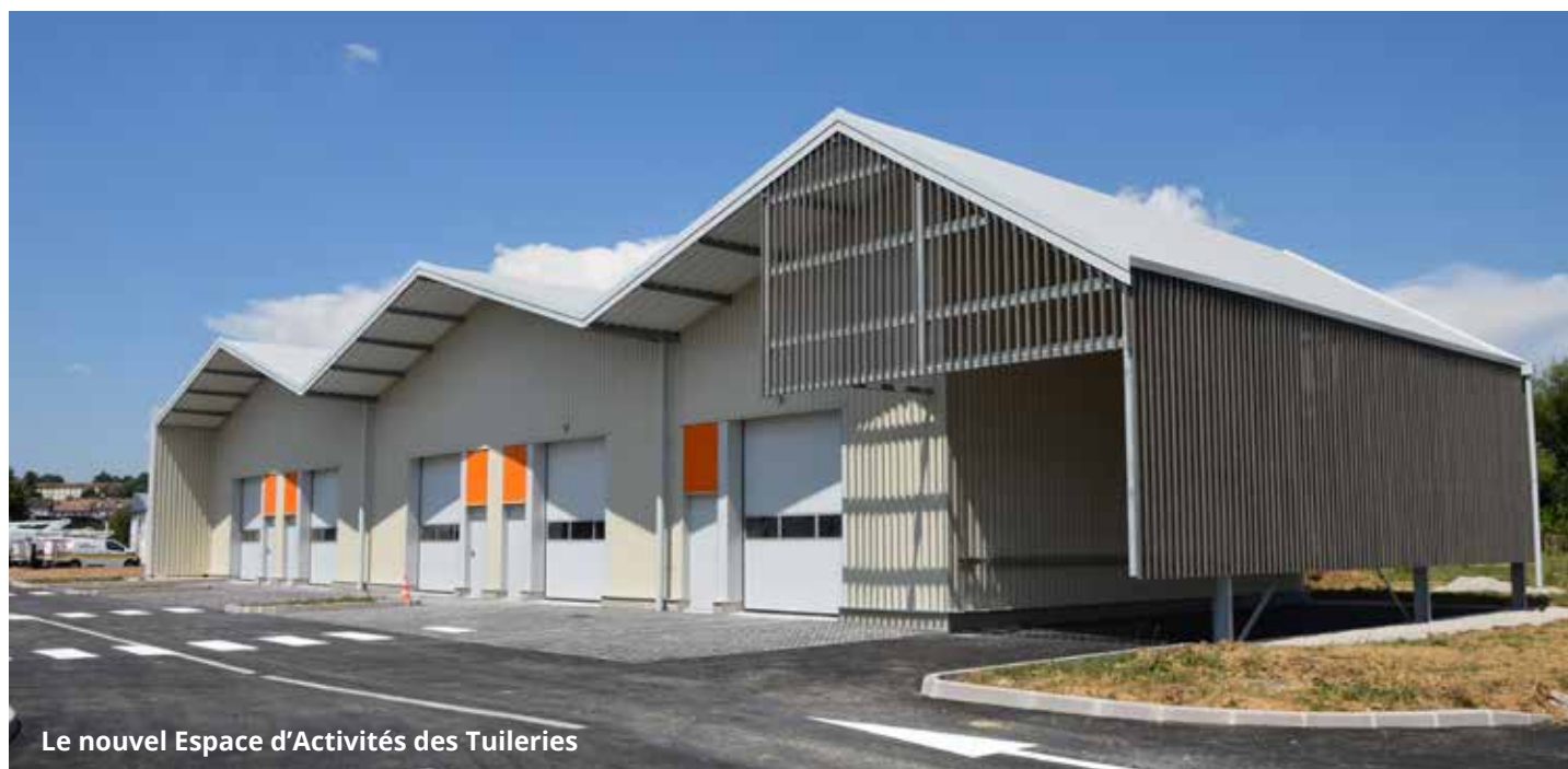
Le nouvel Espace d'Activités des Tuileries

Inauguré le jeudi 28 août 2025, le nouvel espace d'activités économiques des Tuileries est destiné à l'accueil de nouvelles entreprises artisanales ou de petites industries. Une nouvelle infrastructure pour construire l'avenir du Pays d'Héricourt.