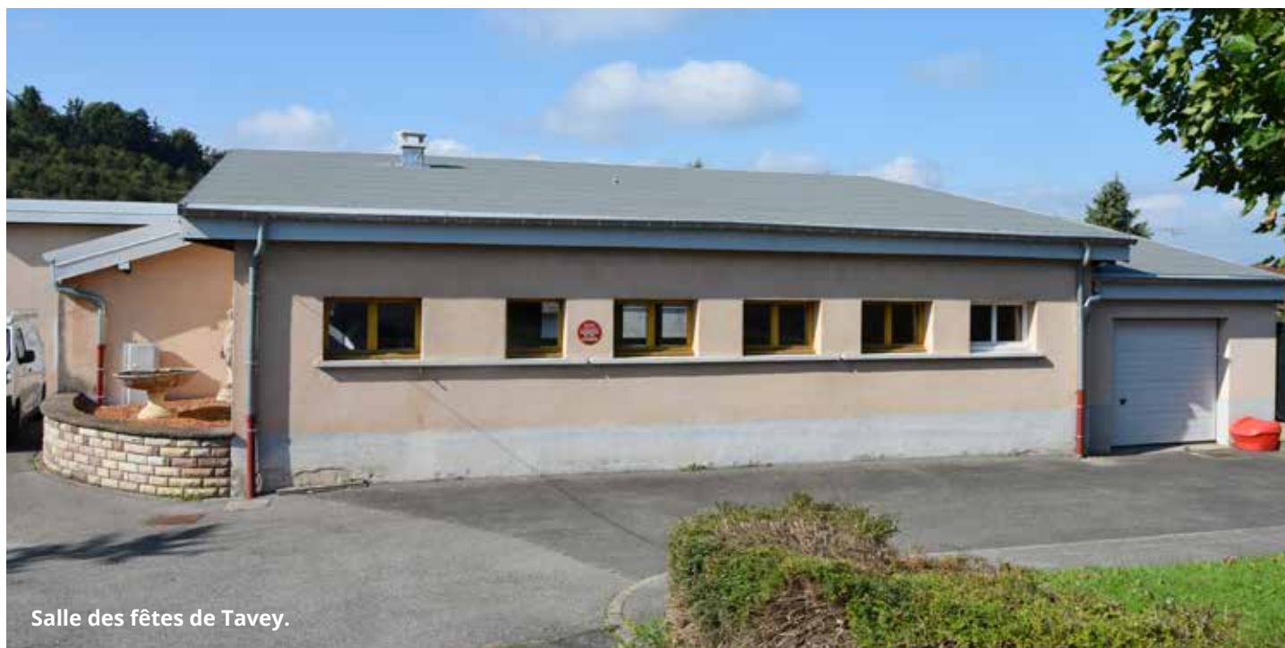
Salle des fêtes de Tavey.

La commune de Tavey a lancé un important programme de rénovation de sa salle polyvalente. L'objectif : offrir aux habitants un espace plus confortable, moderne et adapté aux usages actuels.