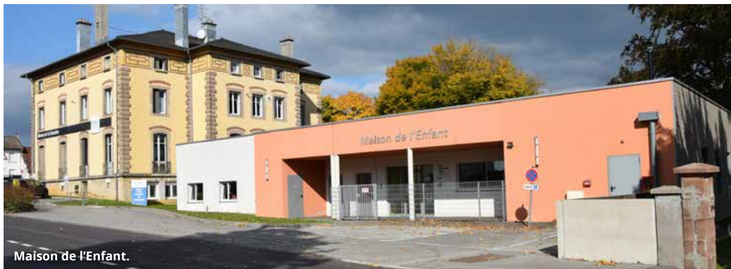
Maison de l'Enfant.

La Communauté de Communes du Pays d'Héricourt poursuit son engagement en faveur de la parentalité avec la création d'un lieu d'accueil Enfants Parents. Un nouvel espace pour compléter le service Petite Enfance.