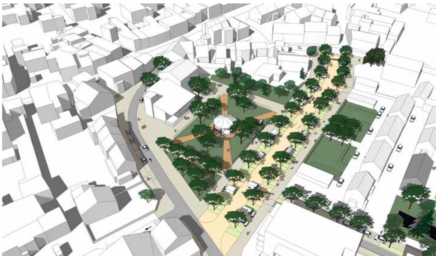
Requalification de la Place du Marché, esquisse numérique n°2.

La future Place du Marché jouera un rôle de liaison naturelle entre la gare routière en cours d'achèvement et le centre ville. Le déplacement des cars scolaires vers la gare routière améliorera la circulation et permettra de désengorger le centre en favorisant les mobilités douces. La nouvelle Place du Marché sera traversée par une piste cyclable depuis la piste de la rue du 11 novembre. Elle se raccordera à la grande dorsale et permettra à ses utilisateurs de rejoindre la gare routière mais aussi la gare ferroviaire, le Lycée Aragon, le Parc urbain et la piste cycliste en direction de Montbéliard.