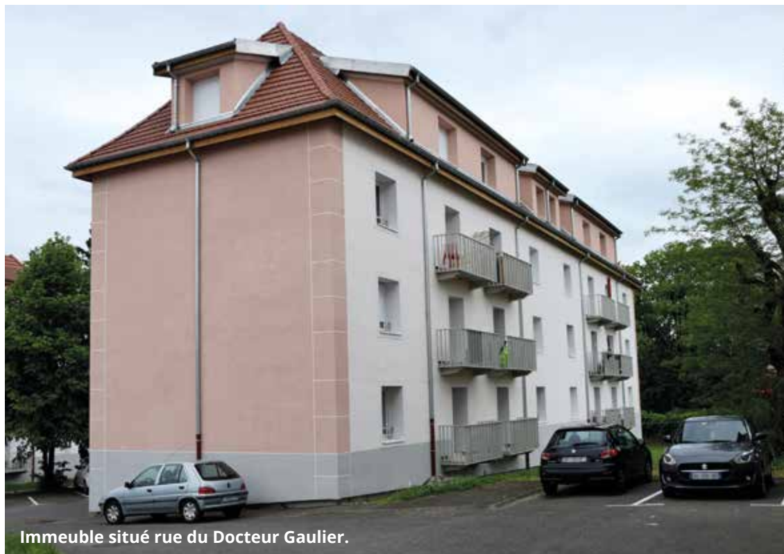
Immeuble situé rue du Docteur Gaulier.

Deux opérations distinctes de rénovation énergétique ont été conduites à Héricourt, rue du Docteur Gaulier et rue Bel-Air. Au cœur de cet ambitieux programme, l'amélioration du confort des locataires et l'esthétique des lieux.