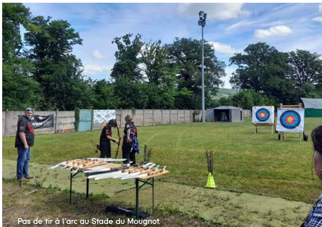
Pas de tir à l'arc au Stade du Mognot.

Les archers du club d'Héricourt ont pris possession de leur nouveau terrain d'entraînement en plein air le samedi 25 mai 2025. Un équipement moderne pour des séances en toute sécurité.