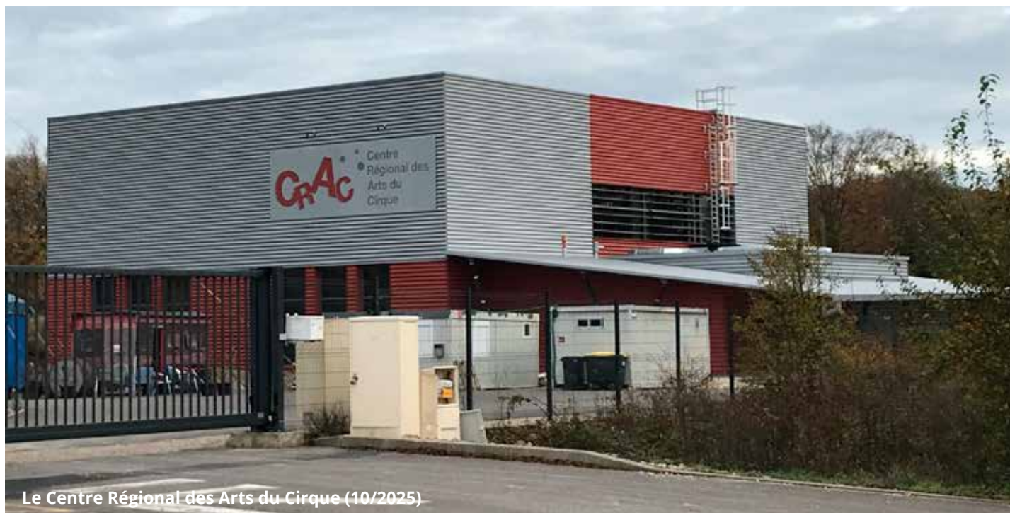
Le Centre Régional des Arts du Cirque (10/2025)

Lancée au printemps 2024, la construction du Centre Régional des Arts du Cirque est terminée. Ce nouvel équipement communautaire à vocation régionale est une étape majeure du développement culturel du Pays d'Héricourt.