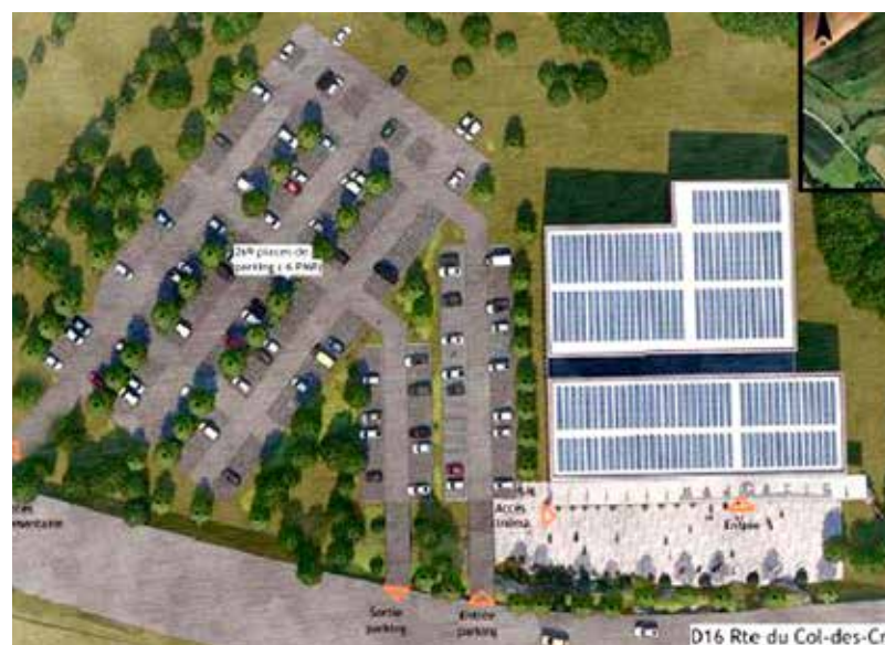
Plan et disposition du parking du cinéma Majestic du Pays d'Héricourt.