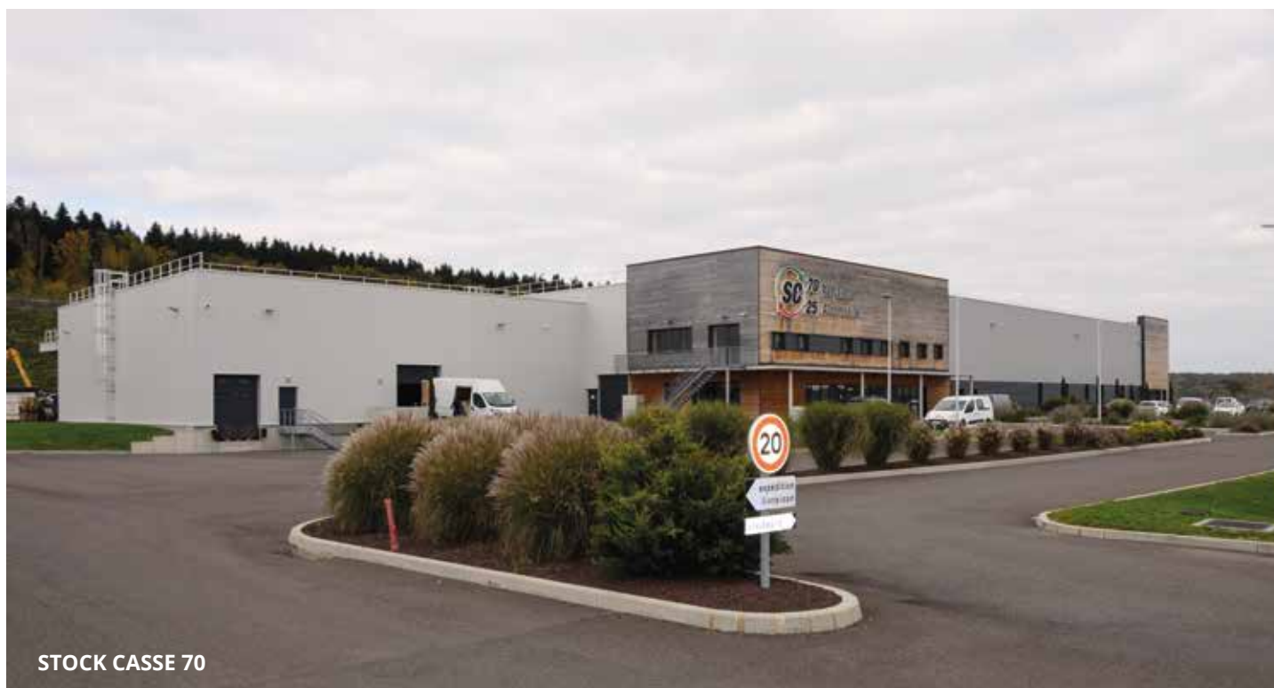
STOCK CASSE 70

Rachetée en juin 2025 par ADB Ecosystem, filiale du Crédit Mutuel, SC70 annonce un ambitieux projet d'expansion : devenir un acteur de référence du recyclage des véhicules électriques et hybrides dans le Grand Est.