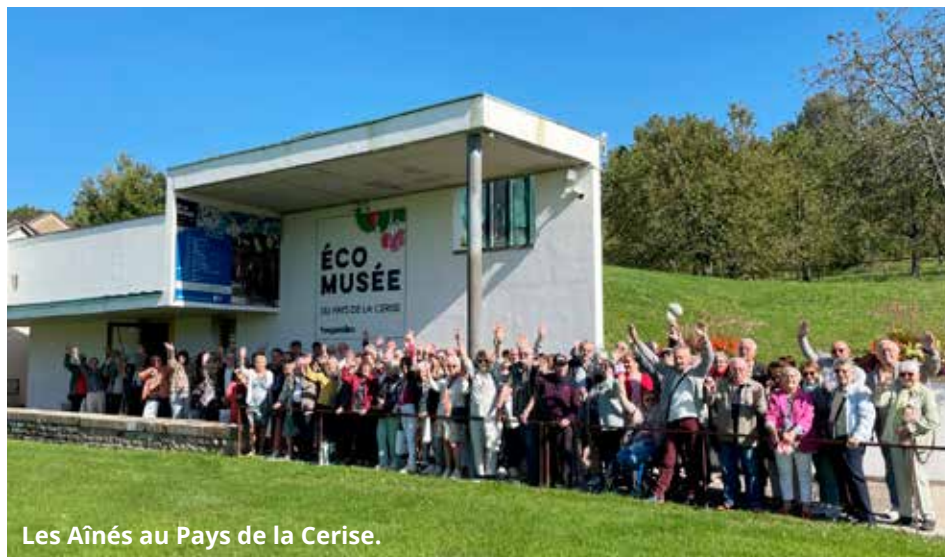
Les Aînés au Pays de la Cerise.

Le Centre Communal d'Action Sociale a organisé avec le soutien de la Commune, une sortie pour les aînés à Fougerolles le jeudi 18 septembre 2025. Voyage au Pays de la cerise et du kirsch.