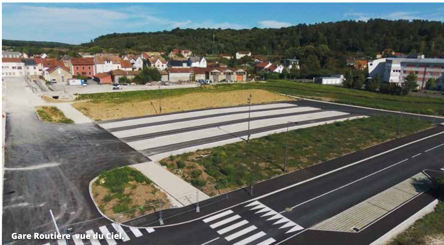
Gare Routière vue du Ciel.

Implantée sur l'ancien site Packmat, la nouvelle gare routière est opérationnelle. Pensée comme un lieu de mobilité moderne et respectueux de l'environnement, elle symbolise le futur de notre Cité.