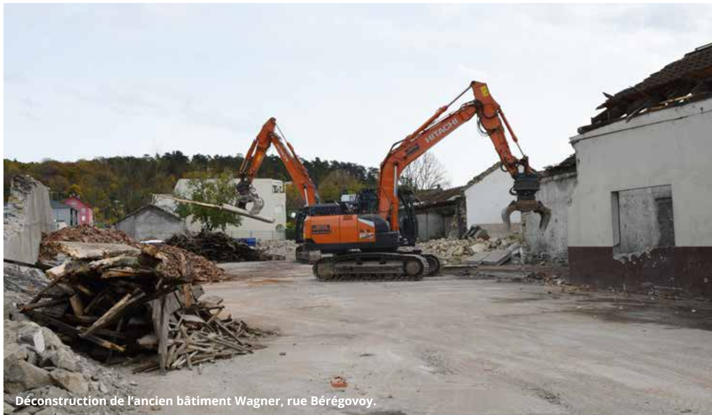
Déconstruction de l'ancien bâtiment Wagner, rue Bérégovoy.

La déconstruction de l'ancien bâtiment Wagner, situé à l'intersection des rues Bérégovoy et Bardot, a débuté le 30 octobre. Ce chantier marque, après l'implantation d'Hermès, d'A2E et du gymnase du Champ de Foire, une nouvelle étape dans la requalification du secteur.