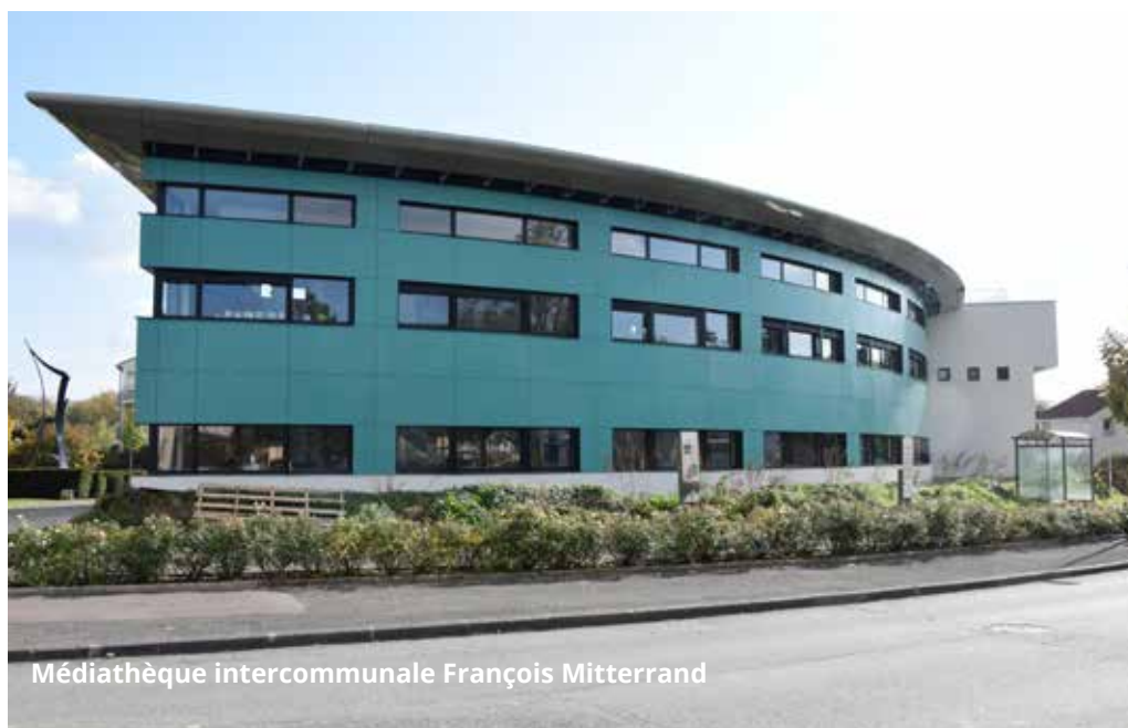
Médiathèque intercommunale François Mitterrand

Après 18 mois de travaux, la Médiathèque intercommunale François Mitterrand a rouvert ses portes au public le 28 octobre 2025. Une rénovation énergétique et fonctionnelle pour un équipement moderne.